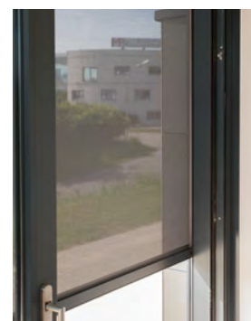
Durchsicht von innen