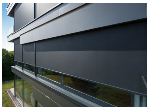
Perfekt für große Flächen bis zu 18 m 2