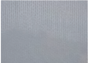
Soltisbespannung (siehe Kollektion Soltis 96)